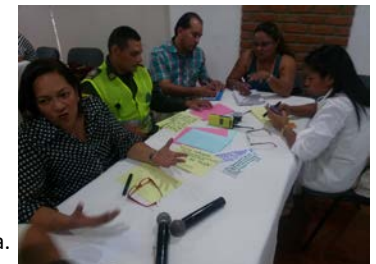
Comité Departamental de Drogas de Guainía.