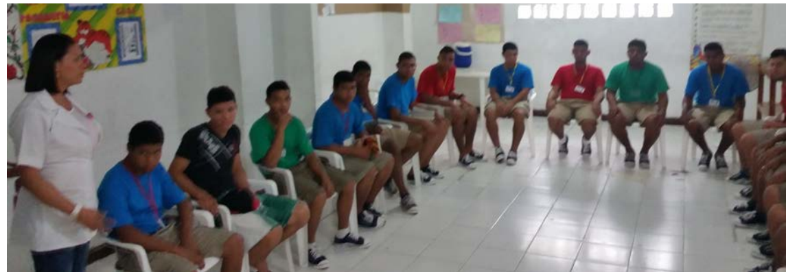
Hogares Claret. Soledad. Atlántico