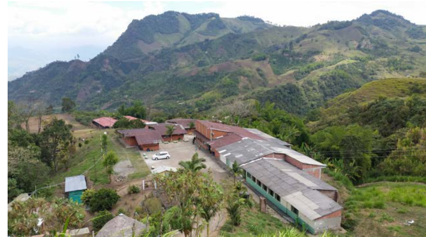
INGRUMÁ. Riosucio . Caldas

Atlántico, Medellín, Pereira, Barranquilla, Cali, Cúcuta, Bucaramanga, Pasto, Popayán, Villavicencio, Armenia