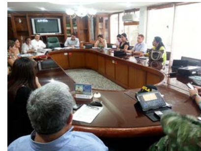
Consejo Seccional de estupefacientes de Caquetá