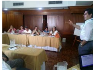
Comité Departamental de Drogas de Bolívar.